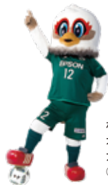
松本山雅FC オフィシャルマスコット ガンズくん ©松本山雅 FC