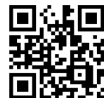
松本駅 アルプス口方面